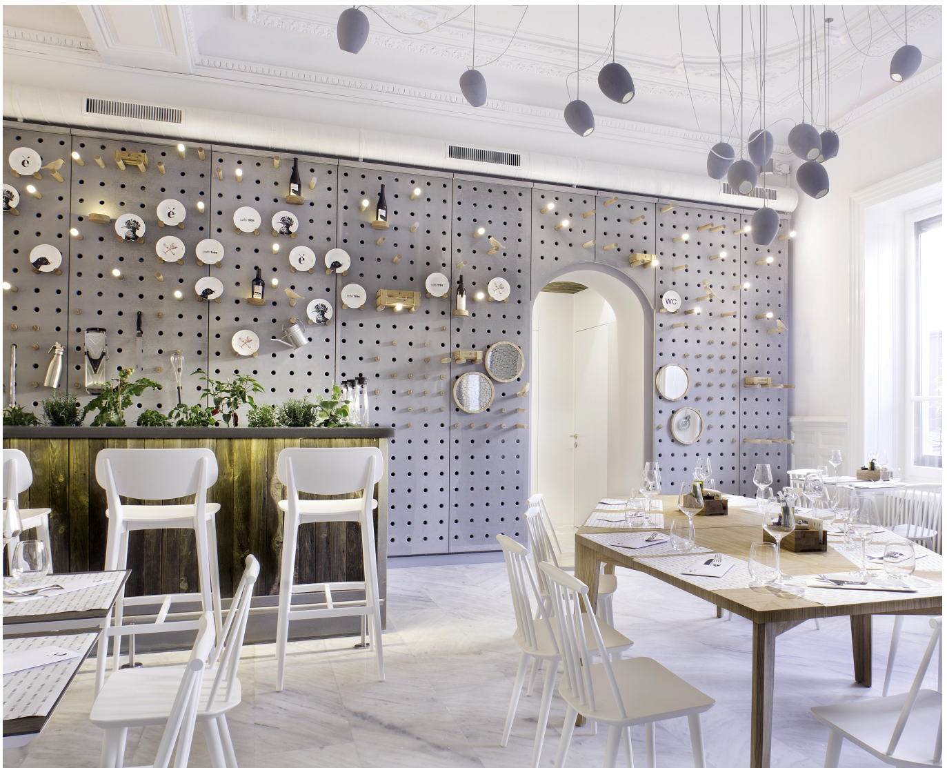
Cafe Tres. Монтрє, Швейцарія. Проект: Drozdov and Partners.

Великі формати, свобода вибору форми і перфорації, варіанти текстури та кольору панелей, так само можливість застосування одного матеріалу в інтер'єрі та екстер'єрі розкривають широкі можливості в архітектурі і дизайні.