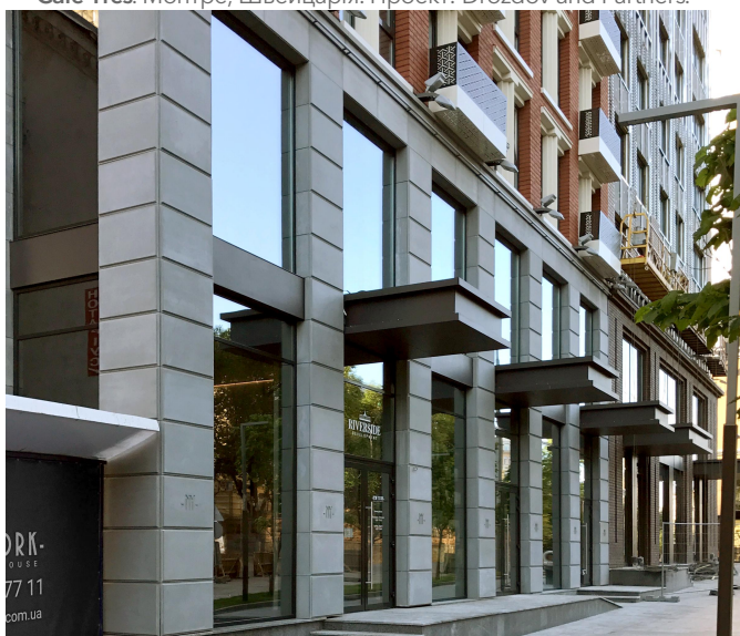
New York Concept House м. Київ. Панелі за спеціальним замовленням.