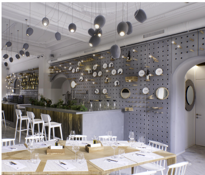
Cafe Tres. Монтрє, Швейцарія. Проект: Drozdov and Partners.